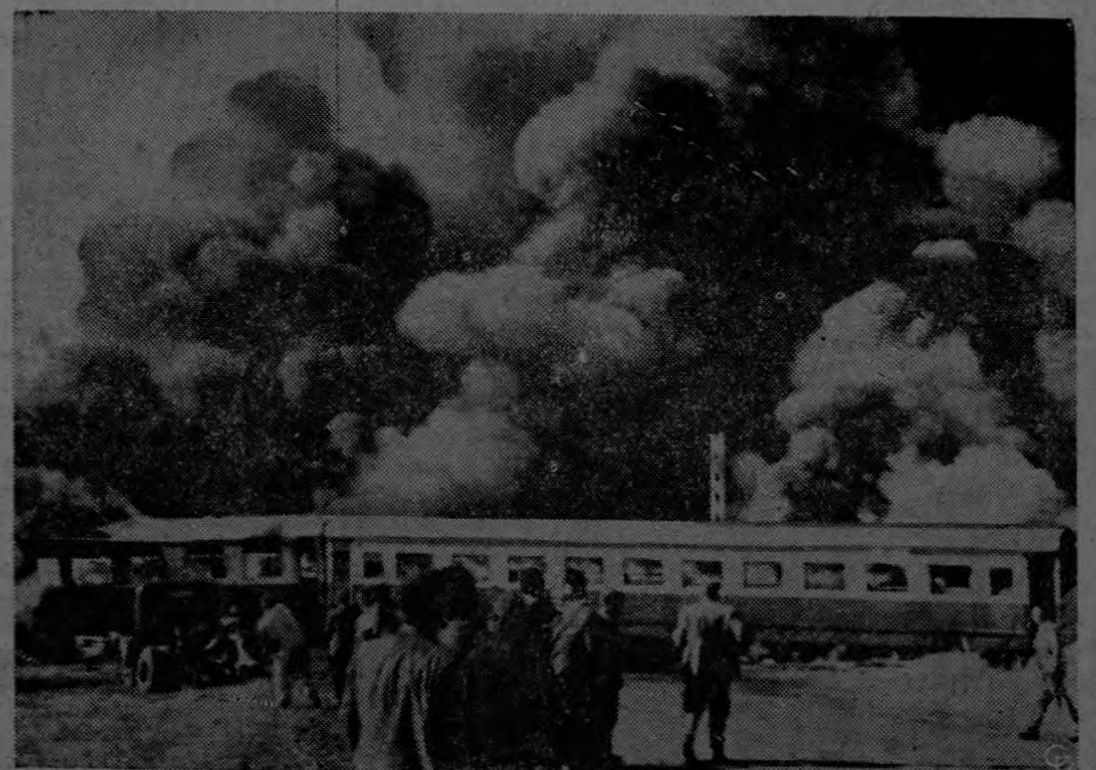
CHOQUE DE TREN CON CAMION-TANQUE. — Densas nubes de humo surgen de un tren diesel de pasajeros, en Zárate, Argentina, después de haber chocado con un

Cuando te enteres de algo, com páralo con la inmensidad de los páralo con la inmensidad de lo que ignoras.